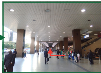
正面口の階段を降りて、右方向に進んでください。