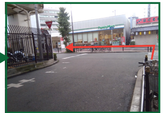
横断歩道を渡って②の角を左に曲がって、まっすぐに進んでください。