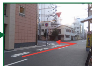
④の角を左に曲がってください。