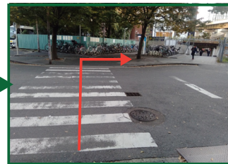
駅治いを進んでいくと左に曲がる横断歩道に突き当たりますので、横断歩道を渡り、右に曲がってください。