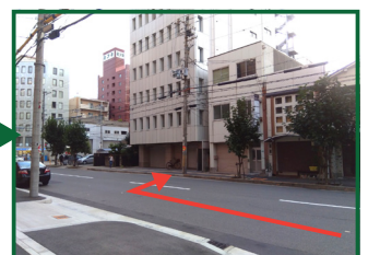
進行方向右側の8階建てのビルに入り、エントランスから6階「ヤマト広告株式会社」をお呼び出してください。