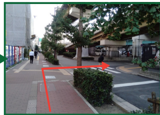
①を右に曲がって高架下に入ってください。