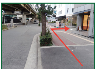
2つ目の曲がり角の③で右に曲がってください。