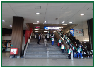
新幹線、または在来線の改札を出て新大阪駅の正面口に出てください。