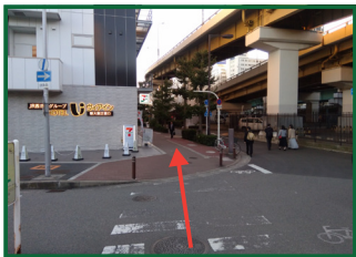
トンネルを出た先の横断歩道を渡ってください。