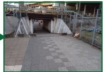
道なりに進んでいくと短いトンネルがありますので、トンネルを通過して反対側の通りに出てください。