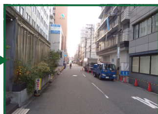
SARASAホテルの角までまっすぐに進んでください。