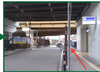
大阪メトロ「新大阪駅」の前を通り、まっすぐに進んでください。